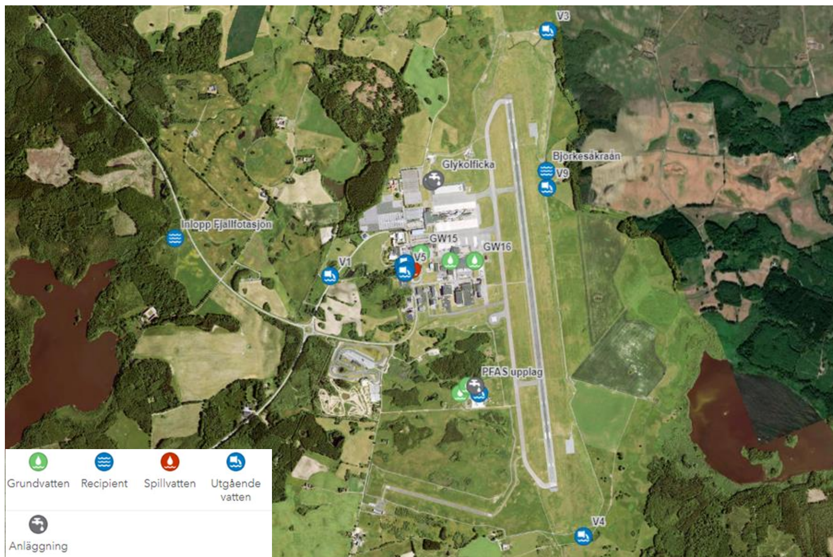
Bilaga 2.1 Karta över provtagningspunkter