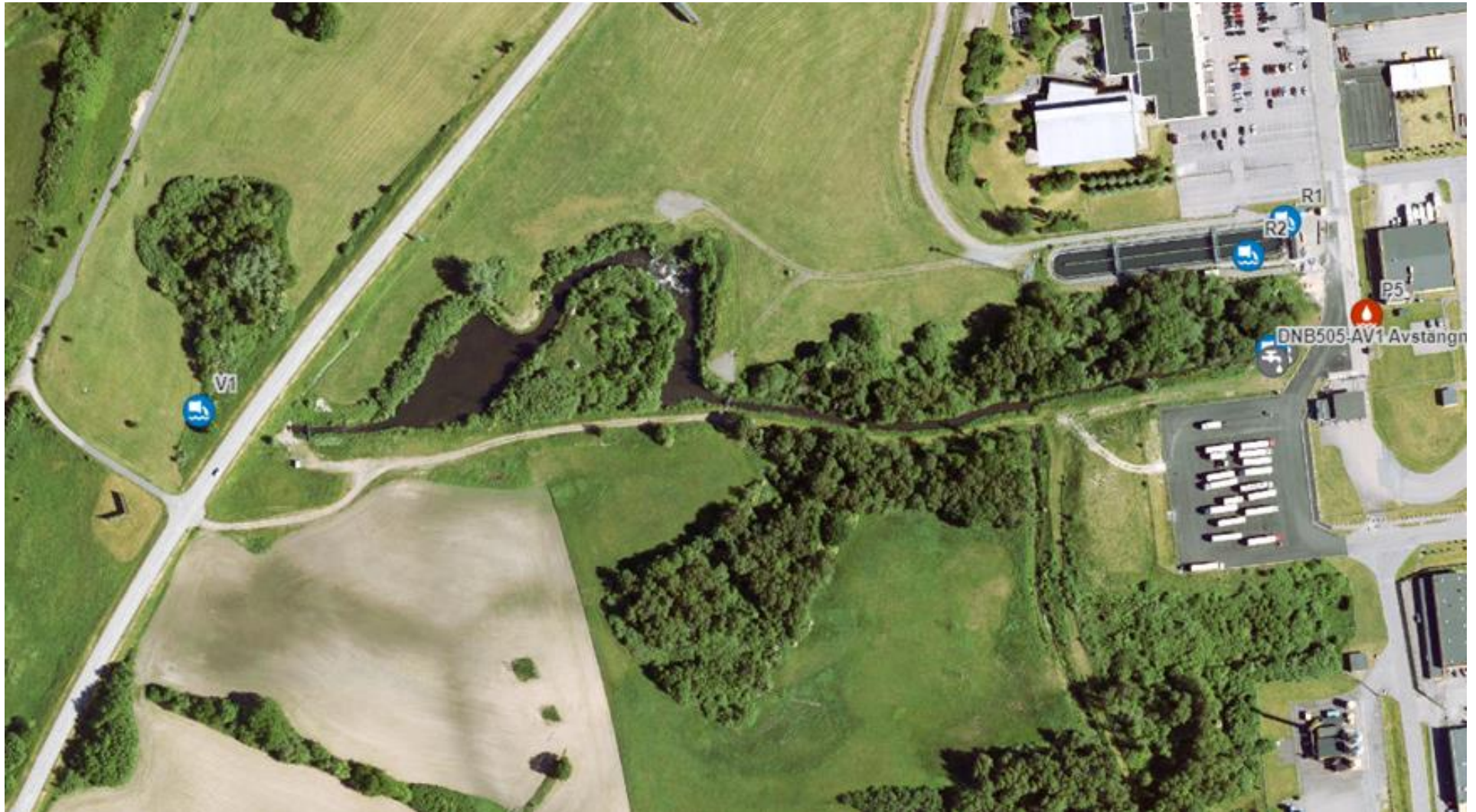
Ny lokalisering av V1