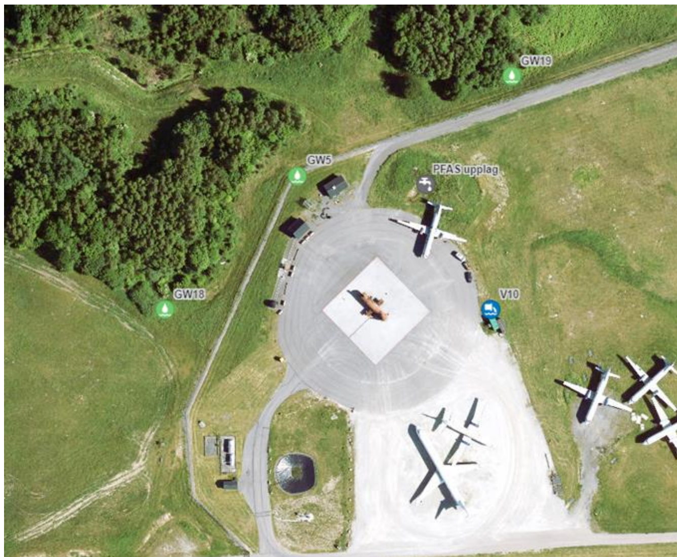
Nya provpunkter i grundvatten vid brandövningsplats GW18 och GW19