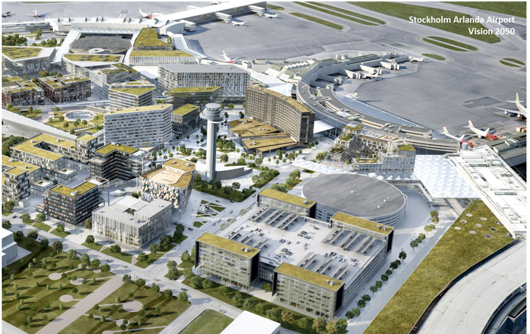
Stockholm Arlanda Airport Vision 2050

Den moderna staden i Stockholm Arlanda Airport innefattar resenav för flyg- och landtrafik kombinerat med effektiva mötesplatser och moderna kontor.